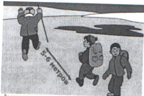
Во время движения группы по льду соблюдайте дистанцию 5-6 м.

- Если Вы передвигаетесь группой, то двигаться нужно друг за другом, сохраняя интервал не менее 5 - 6 метров, также необходимо быть готовым оказать помощь товарищу.